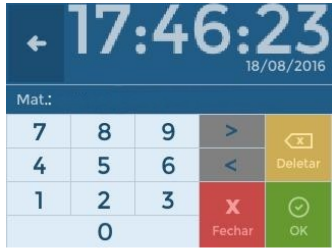
Figura 3: Visor do equipamento

Através do visor TouchScreen do equipamento é possível acessar o teclado, que fornecerá as opções necessárias para realizar marcação de ponto e entrar no menu.