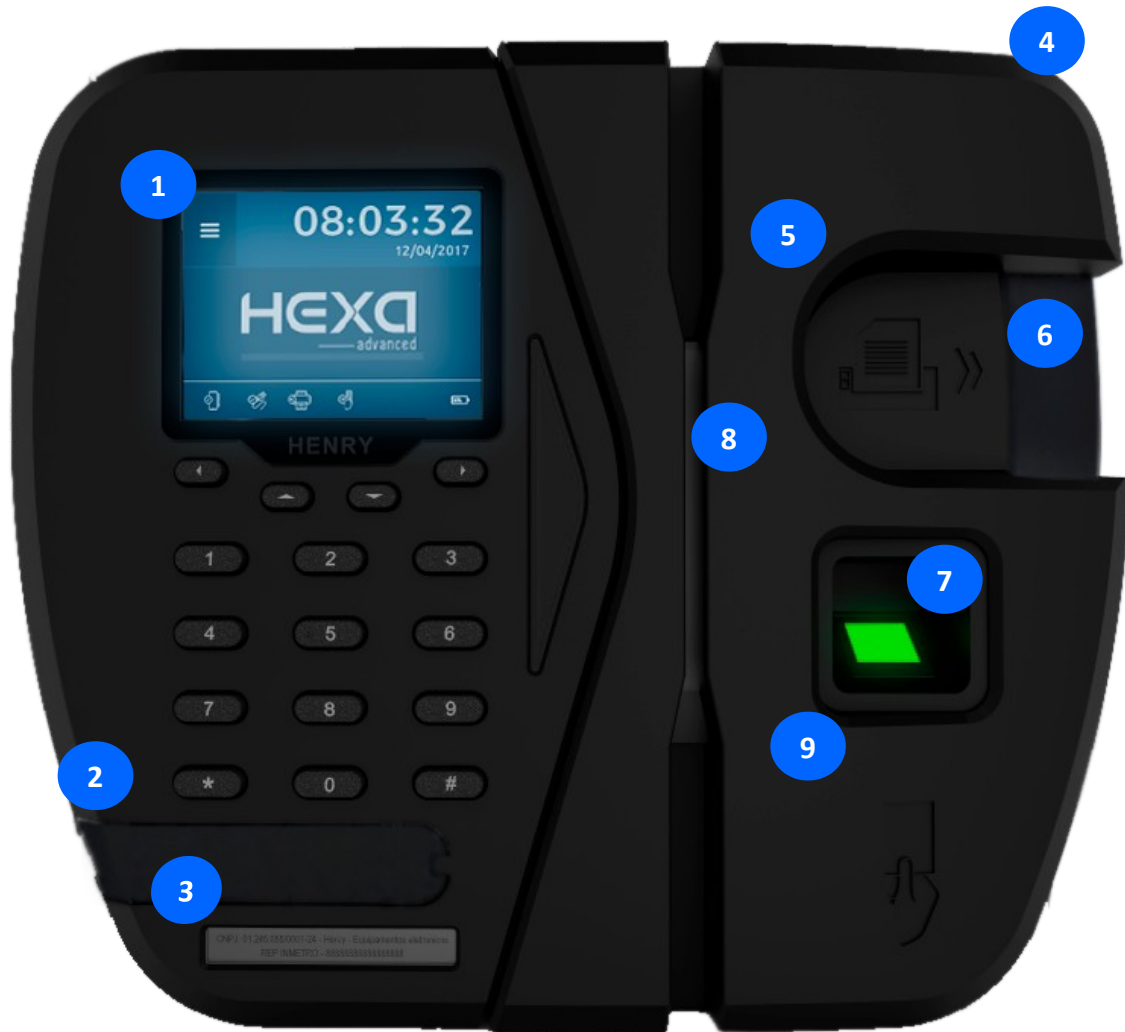
Figura 1: Vista frontal do equipamento