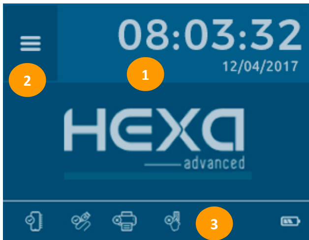
Figura 4: Visor do equipamento em StandBy