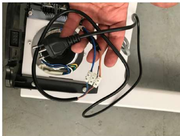
Cabo de energia conectado à placa