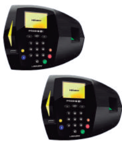
Controle de Acesso Biométrico