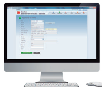
Software Secullum Estacionamento.Net